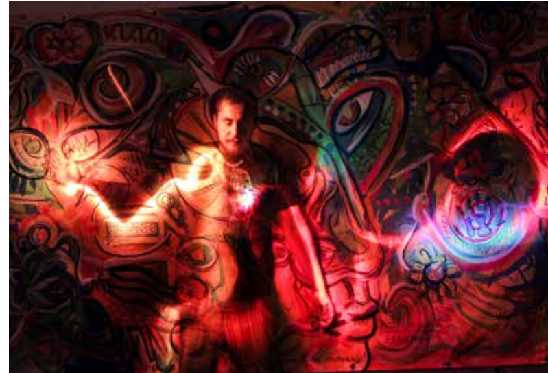
Autoportrait en light-painting sur fresque participative