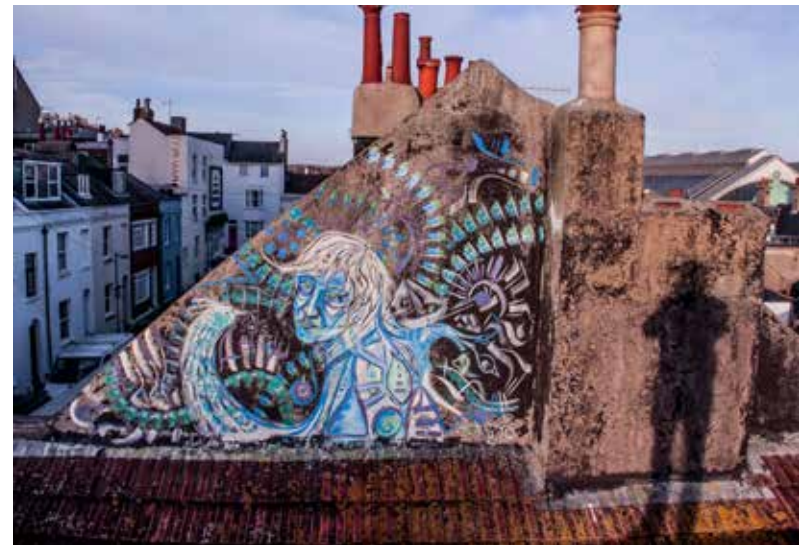
Fresque chez l'habitant sur les toits de Brighton (GB)